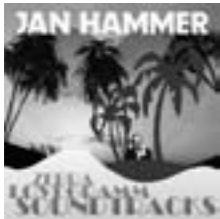
Jan Hammer: Zebra Lovegram Soundtracks BMG

kann. Das Zeug ist grausam, trocken, stählern, auch monumental, im Bann des »Leni Riefenstahl Approach« (Dawson Leery), und leuchtet so unmittelbar ein, daß man außer einem Nervensystem, dem genannten Kontext und einigen kulturgenealogischen Überlegungen, wie sie dieser Text soeben beizubringen versucht hat, nicht viel braucht, um diese Platte sehr gelungen zu finden.