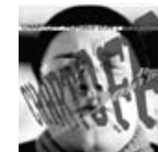
Chartoff: Horses Don't They Slamrock/Zomba

Derart umsichtig dachte der Genosse über sich und die Sache nach. Bevor er uns Lebewohl sagen mußte, war seine Seele, oder wie das nackte Geknussel heißt, schließlich so groß, so weit geworden, daß äußere Einflüsse, freudiger oder betrübender Art, die kostbare Tiefe nicht mehr aufwählen konnten, sondern nur noch wie alsbald in sich